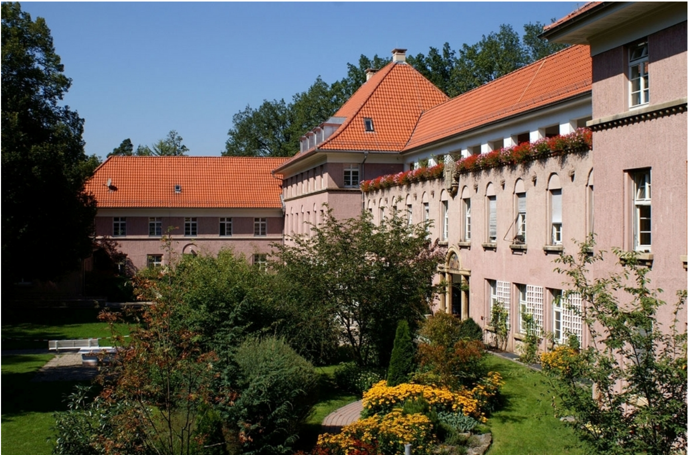
Abbildung: Klinik im Rudolf-Sophien-Stift